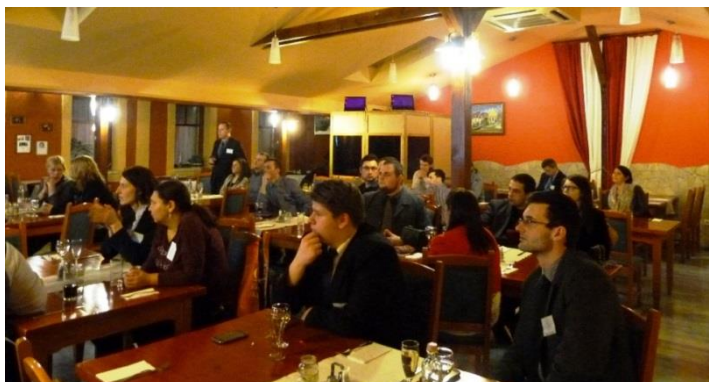
11. ábra: Fogadás az Alapítvány 20. évfordulójának alkalmából

A konferenciát támogatta a Rockefeller Brothers' Fund , a European Joint Fund for Hungary , a Pataki Kerámia és Balaton Község Önkormányzata . Felajánlásaik tették lehetővé, hogy a programot megvalósíthassuk, a résztvevőket megvendégljük, és megajándékozzuk azon meghívott vendégeinket, akiknek meghatározó szerepük volt/van az Alapítvány életében.