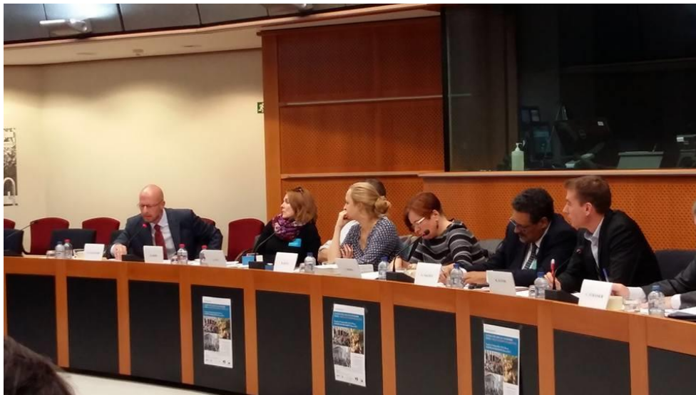
4. ábra: Paul d'Auchamp (balról) előadása a szemináriumon

2016. október 11-én Brüsszelben, az Európai Parlamentben került megrendezésre – Jávor Benedek, EP képviselő szervezésében egy nemzetközi szeminárium „Szűkülő civil tér Kelet- Közép Európában és az Európai Unióban” elnevezéssel. A rendezvényen előadtak: a Norvég Civil Támogatási Alap lebonyolításáért felelő civil szervezetek igazgatói – köztük igazgatónk, Bata Boglárka is -, Paul d'Auchamp, az ENSZ Emberi Jogi Főbiztosságának megbízott képviselője, Gerry Salole az Európai Alapítványi Központ ügyvezetője, Christian Strasser az Európai Bizottság képviselője. (Az eseményről és résztvevőiről bővebb információ ezen a linken található: https://norvegcivilalap.hu/en/node/188584 )