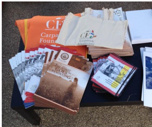
3. ábra: Az Európa-sátorban lehetőségünk nyílt Alapítványunk bemutatására

Támogatási Alapot (az eredményekre fókuszálva), majd mindketten részt vettek egy workshopon, amelynek témája a finanszírozás, pénzügyi fenntarthatóság és a tagság, kapcsolatok voltak. A következő napon meglátogatták az ONG Fest nevű eseményt a Herastrau Parkban, ahol a civil szervezetekkel és a munkájukkal lehetett megismerkedni. A szervezők két csoportban „vezetett túrát” szerveztek, és témakörök szerint bemutatták a szervezeteket. A sátrak között helyet kapott egy Európa sátor is, ahol az Alapítvány angol nyelvű anyagait tudtuk kihelyezni, illetve az érdeklődőkkel pár szót váltani. Az ENSZ bukaresti képviselétén is fogadták a résztvevőket, ott 3 moldovai szervezet képviselője mutatta be civil fejlesztési programját, eredményét. Az esemény jó alkalom volt arra, hogy több szervezet képviselőjével is kapcsolatot kezdeményezzünk, építsünk.