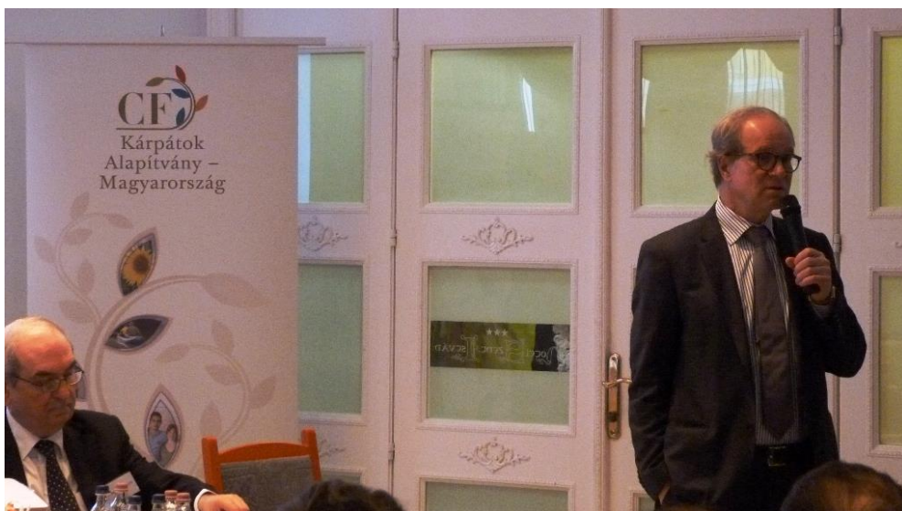
9. ábra: Arild Moberg Sande, a Norvég Királyi Nagykövetség, követtanácsosa, ideiglenes ügyvivője köszöntőt mond

A Kárpátok Alapítvány megalakításának 20 éves évfordulója alkalmából nemzetközi konferenciát rendeztünk Egerben, 2016. január 28-án. A rendezvényen 70 fő magyar és külföldi vendég vett részt, ezért a konferencia szinkrontolmácsolással zajlott angol és magyar nyelven. A konferencia részletes programja itt található: http://www.karpatokalapitvany.hu/sites/karpatokalapitvany.hu/files/program_CF20.pdf