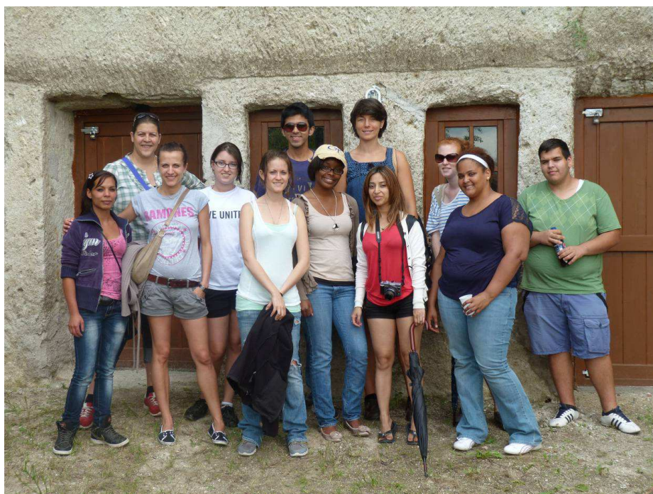
A NYÁRI EGYETEM RÉSZTVEVŐI SZOMOLYÁN

A fiatalok 4 hétig tartó magyarországi látogatásuk során elsősorban a Magyarországon működő szociális vállalkozásokat, valamint budapesti és vidéki civil szervezetek működését tanulmányozták.