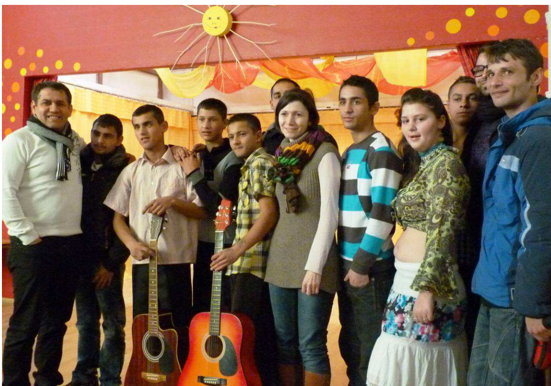
A PROJEKT RÉSZTVEVŐ SZEPSIBEN, SZLOVÁKIÁBAN