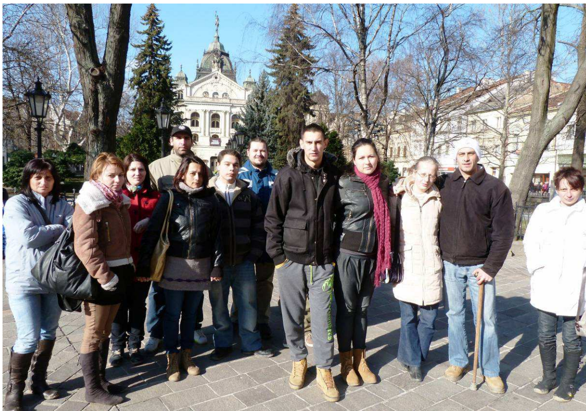
A PROJEKT RÉSZTVEVŐI KASSÁN

A projekt keretén belül 2012. december 14-15-én került megrendezésre az első közös fórum és tréning Egerben és Szomolyán. Az első nap alkalmával a magyarországi és szlovákiai résztvevők, partnerek találkoztak és bemutatták egymásnak a szervezeteiket, településüket és a projekt ötletüket, melyet pontozással értékelték. A második napon a résztvevők jó-gyakorlat látogatáson vettek részt.