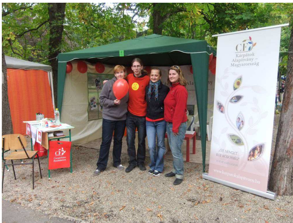
A STÁB PÁR TAGJA EGER CIVIL ÜNNEPÉN NÉPSZERŰSÍTŐ PROGRAMJAIT